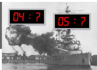
Wieczerz Warszawski - 1 września 1939 - str. 3