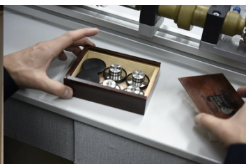
Pudełko z dyszami Venturiego o przepływie krytycznym