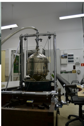
Kolba pomiarowa o objętości nominalnej 25 dm 3