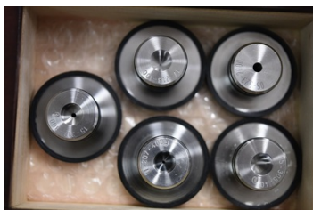
Dysze Venturiego o przepływie krytycznym