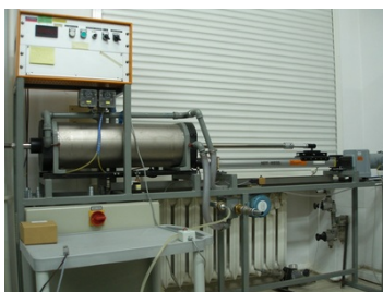
Stanowisko pomiarowe z wzorcem tłokowym

Autor : Arkadiusz Zadworny Opublikowane przez : Adam Żeberkiewicz