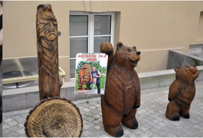
Rzeźby Andrzeja Zawadzkiego