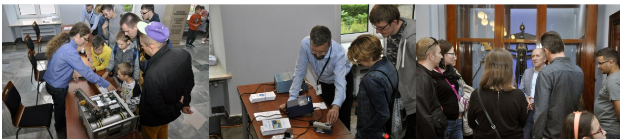
Stoisko Laboratorium Czasu i Częstotliwości