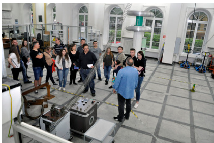
W Hali Wysokich Napięć Laboratorium Elektryczności i Magnetyzmu