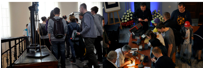
Stoisko OUP Kraków i OUP Warszawa