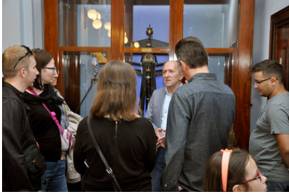
Przy historycznej wadze angielskiej firmy Certling