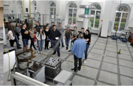
W Hali Wysokich Napięć Laboratorium Elektryczności i Magnetyzmu