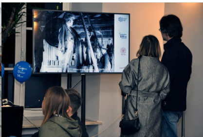
Na monitorze: slajdy pokazujące historię GUM