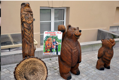
Rzeźby Andrzeja Zawadzkiego