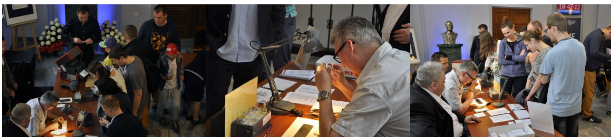
Stoisko OUP Kraków i OUP Warszawa