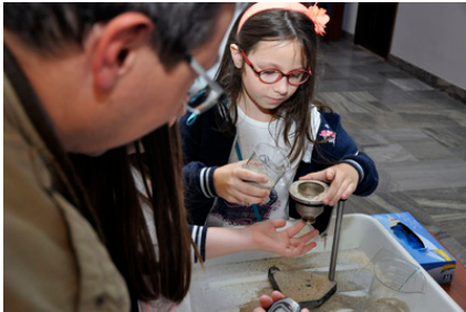
Doświadczenie z dziedziny lepkości