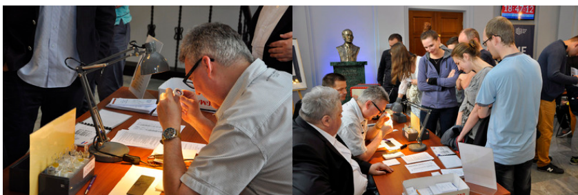
Stoisko OUP Kraków i OUP Warszawa