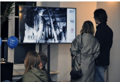
Na monitorze: slajdy pokazujące historię GUM

Na zwiedzających czekały też liczne atrakcje na stoiskach oferujących doświadczalne poznanie różnych dziedzin metrologicznego świata.