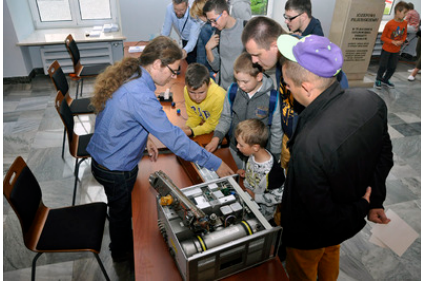
Stoisko Laboratorium Czasu i Częstotliwości