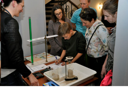
Stoisko pomiaru lepkości