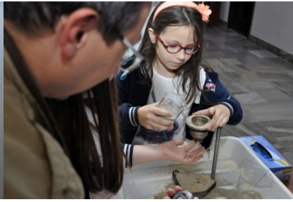
Doświadczenie z dziedziny lepkości