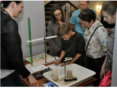
Stoisko pomiaru lepkości