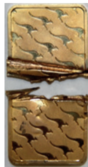
Sztabka o masie 31,0 g, dostarczona w opakowaniu australijskiej mennicy (Perth Mint Australia). Według oznaczeń złoto próby 0,999. Badania wykazały, że została wykonana ze stopu metali nieszlachetnych