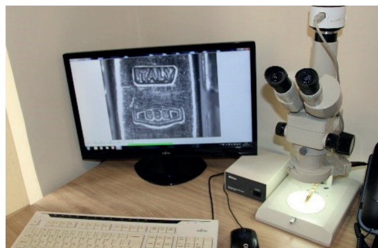
■ Stanowisko przeznaczone do obsługi klientów w Wydziale Nadzoru OUP w Warszawie