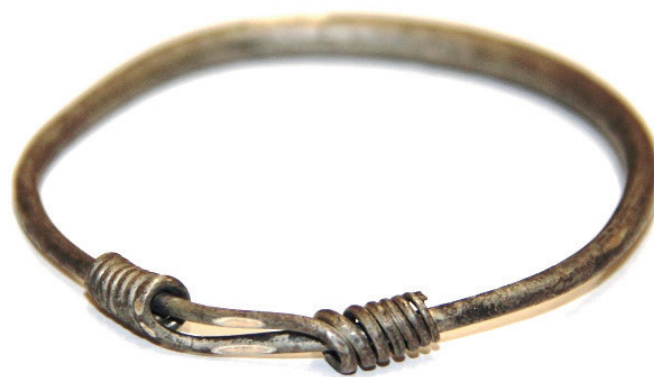
Bransoleta o masie 20,6 g, wykonana ze stopu metali nieszlachetnych. Badania wykazały, że powłoka zewnętrzna została wykonana ze srebra (0,903 – 0,908) Ag. Co ciekawe, zawiera szczątkowe ilości bizmutu, ołowiu i cyny. Wnętrze wyrobu – metal nieszlachetny

Do wykonania kompleksowej ekspertyzy niezbędna jest współpraca specjalistów oraz odpowiedni sprzęt, znajdujący się w siedzibie OUP. W bieżącym roku w OUP wykonano już osiem ekspertyz różnego rodzaju wyrobów. Przykłady zgłaszanych do ekspertyzy wyrobów ilustrują fotografie.