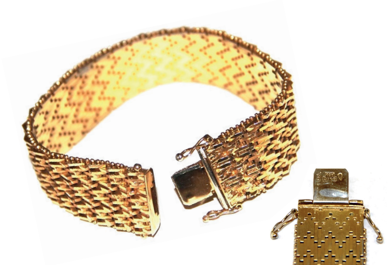
Bransoleta o masie 61,7 g. Na elemencie zapięcia bransolety (języku) zidentyfikowano oznaczenia liczbowe 18K, 0750 oraz 100. Bransoleta wykonana ze stopu metali nieszlachetnych

W ciągu ostatniego roku szczególnie dużo czasu poświęcono na udział w żmudnych, wymagających wielu uzgodnień, pracach legislacyjnych związanych z nowelizacją ustawy Prawo probiercze oraz aktów wykonawczych do ustawy. Projektowane zmiany obejmują w części działalność nadzorczą organów administracji probierczej, co automatycznie wymaga aktywnego zaangażowania w kształtowaniu nowych, dostosowanych