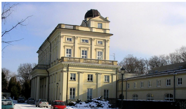
Il. 2. Obserwatorium Astronomiczne Uniwersytetu Warszawskiego – domniemane miejsce, w którym było obserwatorium astronomiczne Boratyniego