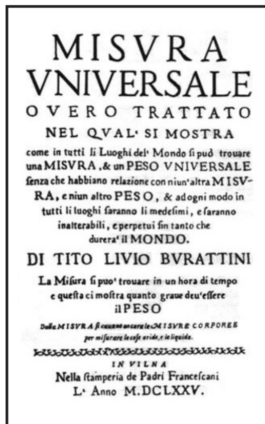
Il. 3. Strona tytułowa Misura Uniwersale. Wydanie wileńskie. (Muz. Miar): Tłumaczenie strony tytułowej: Miara powszechna czyli prawdziwy traktat, w którym ukazano jak można ustalić dla wszystkich miejsc na świecie miarę i ciężar powszechny, które nie byłyby zależne od żadnej innej miary i żadnego innego ciężaru i które w każdym miejscu na ziemi miałyby taką samą wartość, były niezienne i wieczne, aż do końca świata – przez Tytusa Liwiusza Burattiniego. Miarę można ustalić w ciągu jednej godziny – po czym wskaże nam ona ciężar. Z miary podstawowej można uzyskać miary pochodne służące do pomiaru ciał stałych oraz cieczy. W Wilnie w Drukarni OO. Franciszkanów roku MDCLXXV

można było odtwarzać w dowolnym czasie i miejscu. Podał też sposoby wprowadzenia w życie zaproponowanego systemu. Nie wiedział wówczas jeszcze, że długość wahadła sekundowego w istocie jest zmienna i zależy od szerokości geograficznej. Nasz bohater mylił się jednak twierdząc, że nikt przedtem o mierze powszechnej nie myślał. O kilka lat wyprzedzili go Krzysztof Wren, Robert Hooke i Gabriel Mouton, którzy w 1666 r. publicznie rozważali możliwość zastosowania wahadła jako wzorca długości. Nie umniejsza to w niczym odkrycia Boratyniego, choć dopiero przeszło sto lat później nową miarę uniwersalną przyjęto do stosowania i nazwano „metrem”. Przewaga Boratyniego nad nimi polegała na tym, że szczegółowo opisał zjawiska i zależności prowadzące do ustalenia relacji wiążących z sobą jednostki powierzchni, objętości i masy, a także i to, że nową